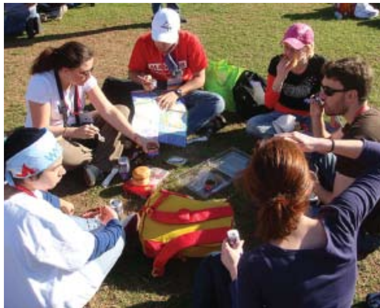
No Brasil, os jovens estão entre as principais vítimas da Aids

Em um ano, o açúcar se destacou por ter registrado aumento em todas as 17 capitais, com variações entre 21,71%, em Belo Horizonte e 78,38%, em Salvador. As fortes altas são conseqüências da demanda internacional e do câmbio. A entressafra da cana também contribui para o aumento.